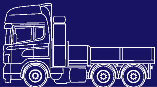
Solofahrzeug mit 4 m Brücke